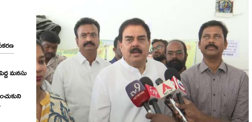
గంటల్లోనే 94% నిధులు రైతుల ఖాతాల్లో జమ చేయడం చారిత్రాత్మక రికార్డు అని పొరసరఫరాల మంత్రి నాదెండ్ల మ.నోహర్ తెలిపారు. రాష్ట్రం నుంచి 8 లక్షల మెట్రిక్ టన్నుల బాయిల్డ్ రైన్ సేకరించేందుకు కేంద్రం ఆమోదం తెలిపింది వెల్లడిస్తూ కేంద్ర ప్రభుత్వానికి ప్రత్యేక ధన్యవాదాలు - మిగతా 2 లో