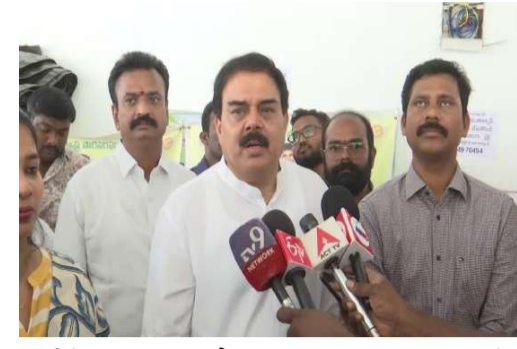
ఎప్పుడీకప్పుడు పరిష్కరిస్తూ పౌరసరఫరాల శాఖ, జిల్లా యంత్రాంగం, కార్పొరేషన్ల సమన్వయంతో ముందుకు సాగుతున్నామన్నారు. ఈ ఖరీఫ్, రబీ సీజన్లలో కలిపి సుమారు 70 లక్షల మెట్రిక్ టన్నుల ధాన్యం సేకరించాలని ప్రభుత్వం ప్రణాళిక సిద్ధం చేసిందని తెలిపారు. ఉమ్మడి కృష్ణా జిల్లాలో ధాన్యం సేకరణ, కొనుగోలు, చెల్లింపుల గురించి రైతులతో నేరుగా మాట్లాడే ఆరా తీశాం. ఎన్టీఆర్

మొరటిపేజీ తరువాయి - తెలిపారు. 24 గంటల్లో 94% చెల్లింపులు: శుక్రవారం విజయవాడ రామవరప్పాడులోని రైతు భరోసా కేంద్రం, మిల్లలను మంత్రి ఆకస్మికంగా తనిఖీ చేశారు. రాష్ట్ర పౌరసరఫరాల సంస్థ ఎం.డి ఎస్. ధీర్జాపుతో కలిసి ధాన్యం కొనుగోలు తీరు తెన్నులుపై సమీక్షించారు. అనంతరం మీడియాతో మాట్లాడుతూ రాష్ట్ర వ్యాప్తంగా రబీ సీజన్లో ఇప్పటివరకు రూ.4,410 కోట్ల విలువైన ధాన్యాన్ని సేకరించామని చెప్పారు. అందులో 94 శాతం నిధులను కేవలం 24 గంటల వ్యవధిలోనే నేరుగా రైతుల ఖాతాల్లోకి జమ చేశామని పేర్కొన్నారు. ఇది చారిత్రాత్మక రికార్డు అని, గత ప్రభుత్వాల హయాంలో నెలల తరబడి నిరీక్షించాల్సిన పరిస్థితి ఉండేదని గుర్తు చేశారు. రాష్ట్రంలో రైతుల సంక్షేమమే ధ్యేయంగా కూటమి ప్రభుత్వం విశ్వాశాత్మక మార్పులు చేపట్టిందని, ధాన్యం కొనుగోలు ప్రక్రియలో గతంలో ఎప్పుడూ లేని విధంగా పారదర్శకత, వేగం, తీసుకోవాల్సిన మంత్రి స్పష్టం చేశారు. ముఖ్యమంత్రి చంద్రబాబు నాయుడు ఆలోచనలను అనుగుణంగా క్షేత్రస్థాయిలో రైతులు ఎదుర్కొంటున్న ఇబ్బందులను