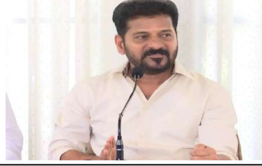
సెక్టార్‌గా గుర్తించామని వెల్లడించారు. తెలంగాణ రాష్ట్ర సమగ్ర అభివృద్ధికి తెలంగాణ రైజింగ్-2047 మార్గదర్శి ప్లాన్‌ను అభివృద్ధిచేయాలని ముందుగానే గుర్తించవచ్చని నిపుణులు చెబుతున్నారు. కోవిడ్-19 మహమ్మారి తర్వాత వస్తున్నట్లుగా వైరస్‌లపై ప్రపంచవ్యాప్తంగా పర్యవేక్షణ పెరిగింది. భవిష్యత్తు మహమ్మారిలను నివారించడానికి ఇలాంటి ముందస్తు హెచ్చరికలు, అంతర్జాతీయ శాస్త్రీయ సహకారం ఎంతో కీలకమని ఈ అధ్యయనం గుర్తించిస్తోంది.

మొరటిపేజీ తరువాయి - వెల్లడించారు. తెలంగాణ రాష్ట్రాన్ని 3 భాగాలుగా అభివృద్ధి చేసేందుకు ప్రణాళికలు రూపొందించామని రేవంట్ రెడ్డి వెల్లడించారు. అందర్ పాని, సర్వీస్, ఎలెక్షన్లపై అనే తీర్మానం విధానాన్ని తీసుకురావాలని అన్నారు. తెలంగాణ రాష్ట్రాన్ని 3 భాగాలుగా అభివృద్ధి చేసేందుకు ప్రణాళికలు రూపొందించామని స్పష్టం చేశారు. క్యూర్, ప్యూర్, రెగ్గా అభివృద్ధి 3 భాగాలుగా విభజించుకున్నామని తెలిపారు. జెలెర్ రింగ్ రోడ్డు క్యూర్ ఏరియాను సర్వీస్ సెక్టార్‌గా గుర్తించామని అన్నారు. ఓ.ఆర్.ఆర్ బయట, ఆర్.ఆర్.ఆర్ లోపల ఉన్న ప్యూర్ ఏరియాను తయారీ రంగంగా గుర్తించామని, ఆర్.ఆర్.ఆర్ బయట ఉన్న రెర్ ఏరియాను అగ్రికల్చర్