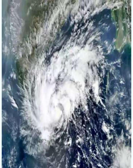
తొలివార్త, అమరావతి, మే 09 : వేసవి ఎండలతో అల్పపీడన ప్రజలకు వాతావరణ శాఖ కీలక అప్డేట్ ఇచ్చింది. బంగాళాఖాతంలో వాతావరణం వేగంగా మారుతోంది. సముద్రంలో కదలికలు మొదలయ్యాయి. శ్రీలంకకు దక్షిణ భాగంలో శుక్రవారం ఒక ఉపరితల ఆవర్తనం ఏర్పడింది. దీని ప్రభావంతో రానున్న రోజుల్లో నెరుతి బంగాళాఖాతంలో అల్పపీడనం ఏర్పడనుంది. ఈ అల్పపీడనం - మిగతా 2 లో