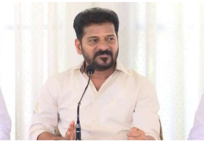
తీర్చిదిద్దే ప్రయత్నం చేస్తున్నామని, సిగ్నల్ ఫ్రీ సిటీగా తీర్చిదిద్దే ప్రణాళికలతో ముందుకెళ్తున్నామని రేవంత్ రెడ్డి పేర్కొన్నారు. ట్రాఫిక్ నియంత్రణకు కేవలం రోడ్ల విస్తరణ మాత్రమే సరిపోదని మల్టీ ట్రాన్స్పోర్టు సిస్టమ్ను అభివృద్ధి చేయాల్సిన అవసరం ఉందని చెప్పారు. పార్లమెంట్ ఇబ్బందులు అధిగమించేందుకు మల్టీ లెవల్ పార్కింగ్ ఏర్పాటు చేస్తున్నామని సీఎం - మిగతా 2 లో