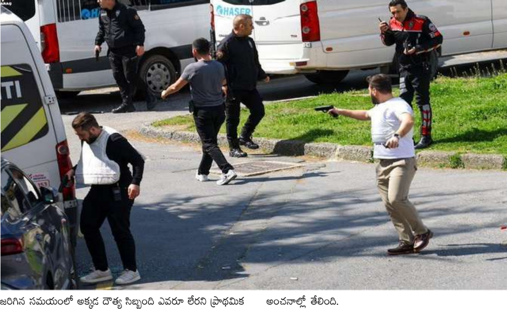
జరిగిన సమయంలో అక్కడ దౌత్య సిబ్బంది ఎవరూ లేరని ప్రాథమిక అంచనాల్లో తేలింది.

మొదటిపేజీ తరువాయి - టర్కీలోని ఇస్టాంబుల్ లో మంగళవారం తీవ్ర కలకలం రేగింది. మానీషు ఇజ్రాయెల్ కాన్సులేట్ భవనం వెలుపల పోలీసులకు, దుండగులకు మధ్య జరిగిన కాల్పుల్లో ముగ్గురు ఛాడీ సేనీన వ్యక్తులు హతమయ్యారు. ఈ ఘటనలో ఇద్దరు పోలీసులకు స్వల్ప గాయాలయ్యాయి. ఔస్కాన్ జిల్లాలోని కాన్సులేట్ భవనం వద్ద ఈ కాల్పులు బోటుచేసుకున్నట్లు స్థానిక మీడియా తెలిపింది. టర్కీ అంతర్గత వ్యవహారాల మంత్రి ముస్తఫా సినీట్లీ ఈ ఘటనపై స్పందిస్తూ, పోలీసులతో సాయుధ పోరాటానికి దిగిన ముగ్గురు వ్యక్తులను మట్టుబెట్టినట్లు ధృవీకరించారు. హతమైన ఉగ్రవాదుల వివరాలను గుర్తించినట్లు వెల్లడించారు. వారు ఇజ్మిత్ నుంచి ఆర్మీ వాహనంలో ఇస్టాంబుల్ వచ్చినట్లు తెలిపారు. వీరిలో ఒకరికి మతపరమైన తీవ్రవాద సంస్థతో సంబంధాలున్నాయని, సోదరలైన ఇద్దరిలో ఒకరికి డ్రగ్స్ కేసు ఉంది. రికార్డు ఉందని ప్రాథమికంగా గుర్తించినట్లు చెప్పారు. ఈ ఘటనపై ఇస్టాంబుల్ చీఫ్ పబ్లిక్ ప్రాసిక్యూటర్ కార్యాలయం వెంటనే దర్యాప్తు ప్రారంభించిందని టర్కీ న్యాయశాఖ మంత్రి ఆకిన్ గుర్రత్ తెలిపారు. ఒక డిప్యూటీ చీఫ్ పబ్లిక్ ప్రాసిక్యూటర్, ఇద్దరు పోలీసులు ఎదుర్కొన్నారు. ఎట్టమీదగా ప్రజల పక్షాన నిలబడతాం" అని స్పష్టం చేశారు. పరిగిలో ఇండస్ట్రియల్ పార్క్ పేరుతో రైతుల అనుమతి లేకుండా సాగిస్తున్న బలవంతపు భూసేకరణను తక్షణమే నిలిపివేయాలని డిమాండ్ చేశారు. రైతుల ప్రయోజనాల కోసం బీఆర్ఎస్ ఎంతటి పోరాటానికైనా సిద్ధమని, బాధితులకు అండగా ఉంటామని చెప్పారు. అక్రమంగా నిర్బంధించిన నేతలను వెంటనే విడుదల చేయాలని డిమాండ్ చేశారు.