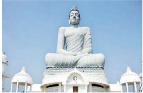
రాష్ట్రపతి డ్రాపిడి ముర్ము సంతకం చేయడం, కేంద్ర ప్రభుత్వం గెజిట్ విడుదల చేయడం అత్యంత సంతోషకరమన్నారు. ఆంధ్రప్రదేశ్ ప్రజలందరికీ ఇది చరిత్రాత్మక సందర్భం అంటూ సోషల్ మీడియాలో పోస్టు చేశారు. ఏకైక రాజధానిగా అమరావతికి అధికారిక మేయడం రైతుల త్యాగానికి, ప్రజల ఆశలకు, భవిష్యత్తు తరాల కలలకు లభించిన న్యాయంగా అభివర్ణించారు. అమరావతి ఇప్పుడు కేవలం ఒక నగరం కాదు, మన అత్యగౌరవం, భవిష్యత్తుకు ప్రతీక అన్నారు. ఆంధ్రప్రదేశ్ ప్రజల చిరకాల స్వప్నాన్ని సాకారం చేయడంలో సహకరించిన రాష్ట్రపతి డ్రాపిడి ముర్ము, ప్రధాని నరేంద్ర మోడీ, హోంమంత్రి అమిత్ షా, ముఖ్యమంత్రి చంద్రబాబు నాయుడికి బాలకృష్ణ ధన్యవాదాలు చెప్పారు. బిల్లుకు మద్దతిచ్చిన పార్టీలు, పార్లమెంట్ సభ్యులు, వెన్నోటి నిలిచిన ప్రజలకు కృతజ్ఞతలు తెలిపారు. అమరావతి అజయంగా, అజరామరంగా వెలుగొందుతుందని ఢీమా వ్యక్తం చేశారు. అందరం కలిసి అమరావతిని ప్రపంచస్థాయి నగరంగా తీర్చిదిద్దదామని బాలయ్య పిలుపునిచ్చారు.

మొదటిపేజీ తరువాయి - చారిత్రాత్మక రోజుని మంత్రి లోకేశ్ హార్షం వ్యక్తం చేశారు. రాష్ట్రపతి డ్రాపిడి ముర్ము ఆంధ్రప్రదేశ్ పునరుద్ధవస్థకరణ సవరణ చట్టం, 2026కు ఆమోదం తెలపడంతో, మన రాజధాని కల అధికారికంగా సాకారమైందని వెల్లడించారు. రాష్ట్ర భవిష్యత్తును దృష్టిలో ఉంచుకుని అండగా నిలిచిన ప్రధాని మోడీకి కోట్లాది తెలుగు ప్రజల తరఫున వ్యూహాత్మక కృతజ్ఞతలు తెలిపారు. పార్లమెంట్ లో ఈ బిల్లుకు మద్దతు తెలిపిన అన్ని పార్టీల ఎంపీలకు ధన్యవాదాలు చెప్పారు. అమరావతి రైతులకు ప్రత్యేకంగా ధన్యవాదాలు తెలిపిన లోకేశ్ వారి సహనం, త్యాగం, నిబద్ధత ఈ విజయానికి పునాదిని అభివర్ణించారు. అందరం కలిసి సాధించిన గొప్ప విజయమిదని కొనియాడారు. అమరావతి అనే అత్యగౌరవానికి, మన భవిష్యత్తుకు ప్రతీక: అమరావతికి రాజముద్ర పడటంపై పాండాపురం ఎమ్మెల్యే సందమూరి బాలకృష్ణ హర్షం వ్యక్తం చేశారు.