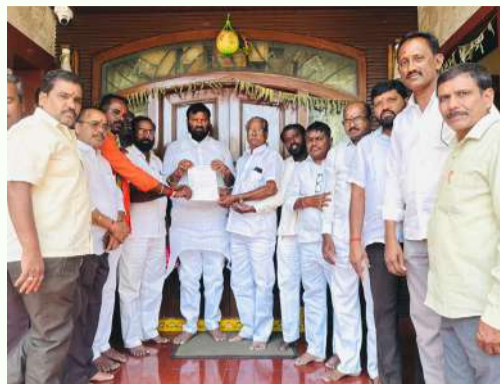
వసూలు చేస్తున్నారని ఇంటి యజమానులు ఈ స్థానిక కృత్యల్లూర్ మాజీ అసోసియేషన్ సభ్యులు కూన శ్రీశైలం గౌడ్ నికలిసి వారు

కృత్యల్లూర్ నియోజకవర్గం, ఏప్రిల్ 7 తొలి వార్త ప్రతి నిధి : అక్రమ ఇంటి నిర్మాణాలంటు జరిమానాలు వేసి మున్సిపల్ సిబ్బంది వసూలు చేస్తున్న టాక్స్ ల గురించి ఈరోజు స్థానిక కృత్యల్లూర్ మాజీ ఎమ్మెల్యే కూన శ్రీశైలం గౌడ్ ని కలిసిన గాజులూరుమార్గంలోని వల్లభ బాయ్ పబ్లిక్ నగర్ అసోసియేషన్ సభ్యులు, కృత్యల్లూర్ నియోజకవర్గం లోని అనేక ప్రాంతాలలో సైబరాబాద్ మున్సిపల్ కార్పొరేషన్ సిబ్బంది వారు వివిధ ప్రాంతాలలో గత 20 సంవత్సరాల క్రితం జిహెచ్ఎస్ సిబ్బంది అన్ని నిర్మాణ అనుమతులు పొంది నిర్మించుకున్న ఇళ్లకు ప్రస్తుతం మున్సిపల్ అధికారులు ప్రావీణ్టీ ట్యాక్స్ మరియు అనధికార నిర్మాణం అంటూ జరిమానాలు వేరుతో వేల రూపాయలు మున్సిపల్ సిబ్బంది