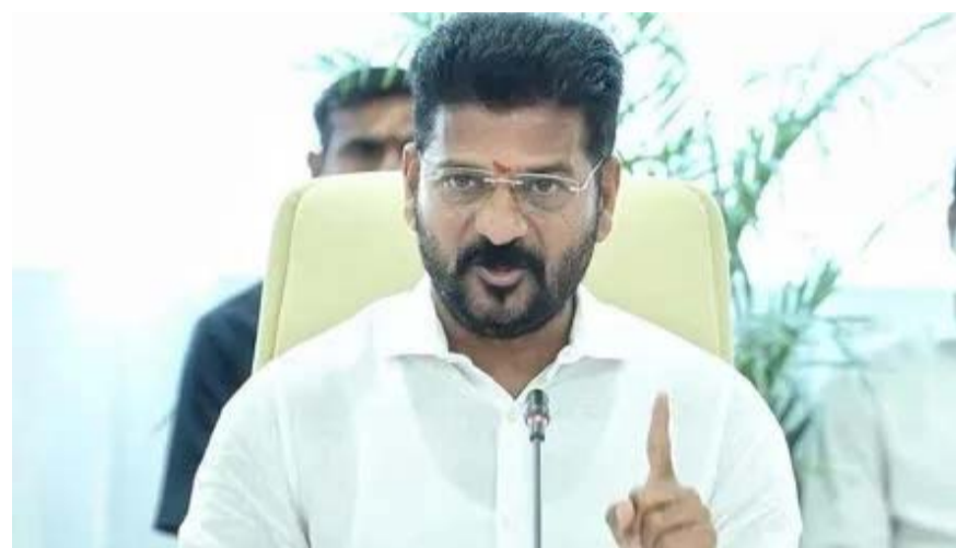
ఆర్థిక సంవత్సరం ప్రారంభం వేళ, రేవంత్ రెడ్డి సర్కార్ తెలంగాణ రాష్ట్ర ప్రజలకు గుడ్ న్యూస్ చెప్పింది. ఎల్ఆర్ఎస్ ఫీజు గడవును మరోమారు పోడిగిస్తున్నట్లు ప్రకటించింది. ఏప్రిల్ మాసంతో వరకు ఈ గడవును.. అది కూడా 25 శాతం రాయితీతో ఫీజు చెల్లించవచ్చని స్పష్టం చేసింది. తెలంగాణ ప్రజలకు రేవంత్ రెడ్డి సర్కార్ గుడ్ న్యూస్ చెప్పింది. - వివరాలు 2 లో