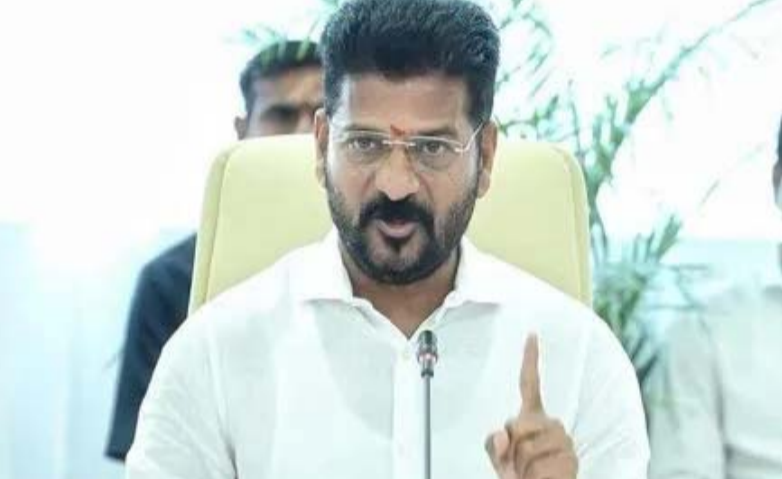
మొదటిపేజీ తరువాయి ఎల్.ఆర్.ఎస్. ఫీజు చెల్లింపు గడువును ఈ మాసాంతానికి అంటే.. ఏప్రిల్ 30వ తేదీ వరకు పెంచుతూ ప్రభుత్వం బుధవారం నిర్ణయం

తీసుకుంది. అసలు అయితే ఈ గడువు మార్చి 31వ తేదీతో పూర్తయింది. కానీ ఈ గడువును మంచుతూ పురోగతిపై సీఎంకు నివేదిక సమర్పించింది డి.డి.